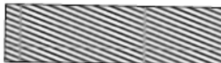
Fig. 2. Titlul figurii titlul (Popescu, 2014)

Text text text text text text text text text text text Text text text text text text text text text text text Text text text text text text text text text text text Text text text text text text text text text text text Text text text text text text text text text text text Text text text text text text text text text text text Text text text text text text text text text text text Text text text text text text text text text text text